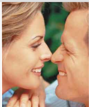
"ПЯТЬ ЯЗЫКОВ ЛЮБВИ" Стр. 9.