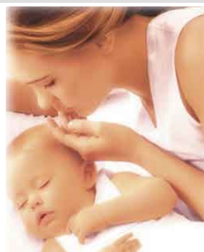
Маленькие советы по уходу за младенцами" Стр. 12.