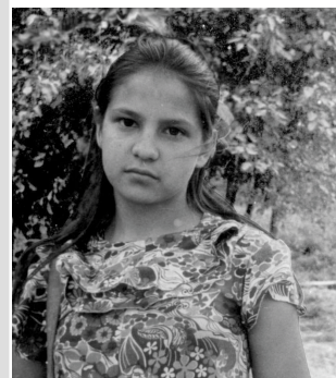
"ПОКАЯНИЕ" Стр 8.