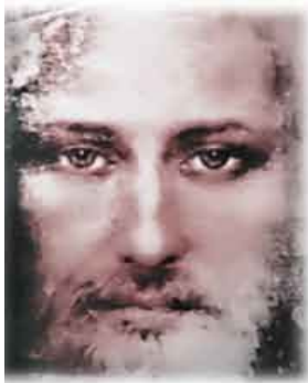
БОЖИЙ ПЛАН Стр. 3